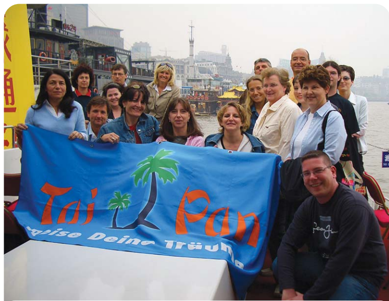
Die Bootsfahrt durch Wuzhen war sicher eines der Highlights der Reise.