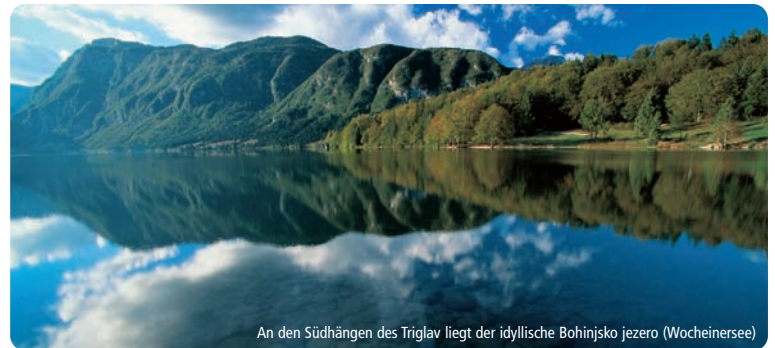
An den Südhängen des Triglav liegt der idyllische Bohinjsee (Wocheinersee)

Eine lebensfrohe Studentenstadt ist Ljubljana, erklärt der Direktor. Entlang der Ljubljanica reihen sich Cafés, Bars, Galerien und kleine Geschäfte aneinander, die Architektur ist stark geprägt vom Jugendstil. Während des traditionellen Sommerfestivals gastieren renommierte