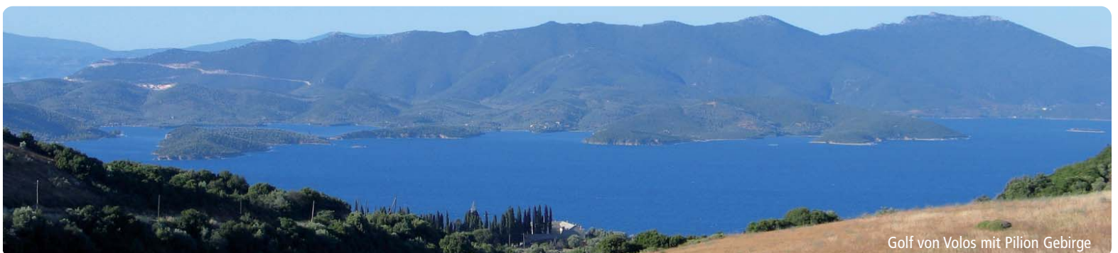
Golf von Volos mit Pilion Gebirge

Beste Reisezeit: Ruhe, Einsamkeit und die kurzen Entfernungen sind optimal für Anfänger wie für Entdecker, die sich treiben lassen. 10 Tage sind optimal, aber eine Woche reicht auch. Ideal von Anfang Juni bis Ende September.