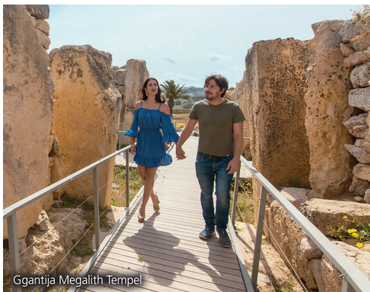
Ggantija Megalith Tempel

Valletta, Mnajdra, Hagar Qim an der Südküste Maltas oder auch Ggantija auf der Nachbarinsel Gozo sind die besterhaltenen Bauwerke aus jener Zeit. Ovale Kammern, aufgerichtete Steinblöcke, hintereinander angeordnete Kammern, die zu einem geweihten Altar führen – alles scheint hier für die Ewigkeit gebaut zu sein. Die Tempelanlagen und Museen werden von Heritage Malta verwaltet und können alle, bis auf das Hypogäum, ohne Voranmeldung besucht werden. Für das Hypogäum müssen die Tickets im Voraus gebucht werden. Übrigens: Die Megalith Tempel auf Malta und Gozo sind älter als die Pyramiden und Stonehenge. www.heritagemalta.mt