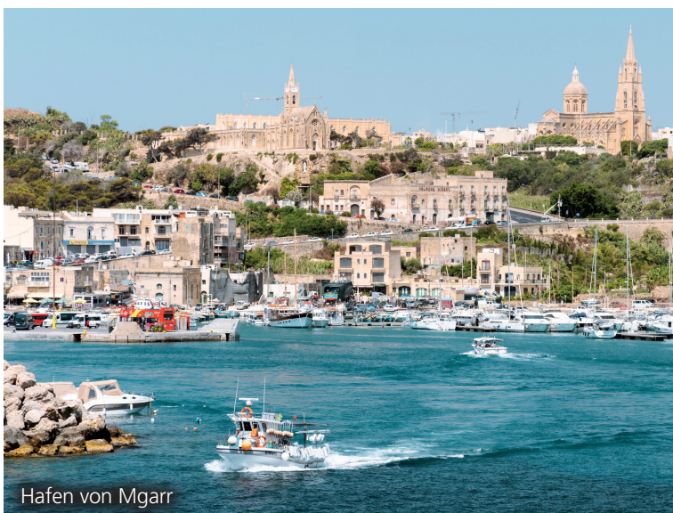
Hafen von Mgarr

Das Fazit: Gozo ist weit mehr als ein Tagesausflug!