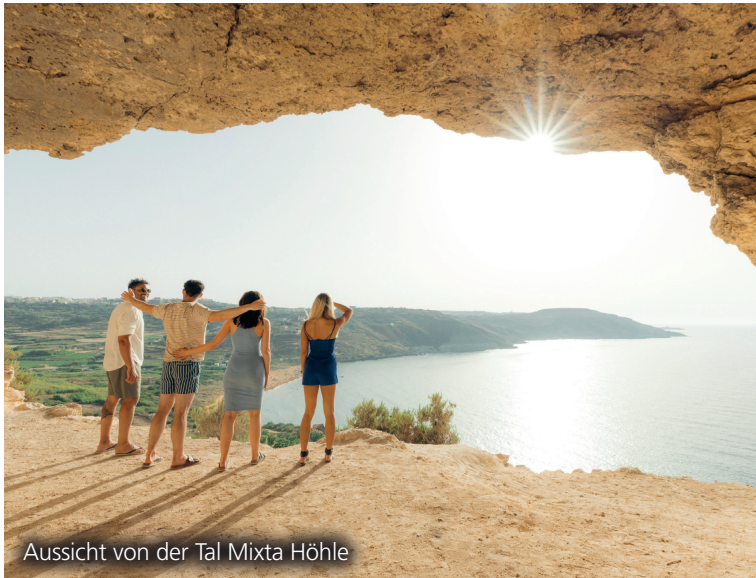
Aussicht von der Tal Mixta Höhle