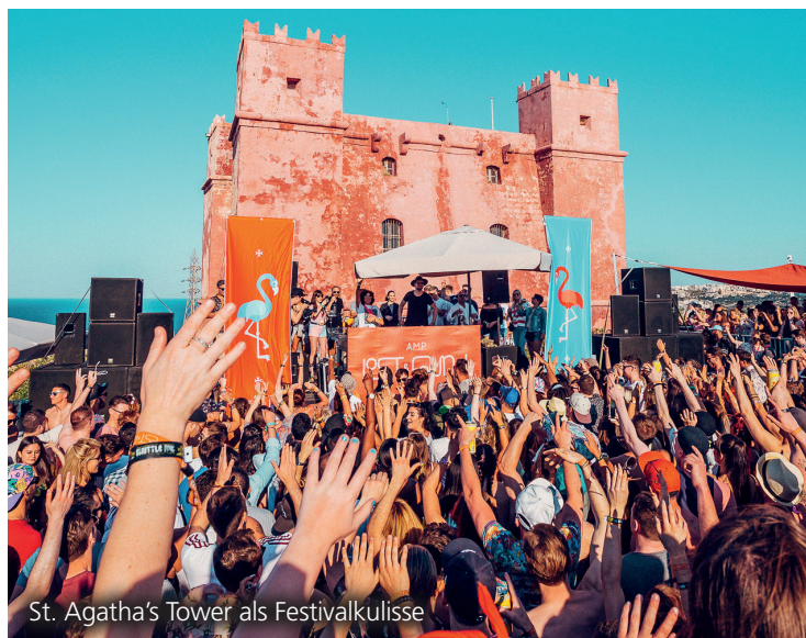
St. Agatha's Tower als Festivalkulisse