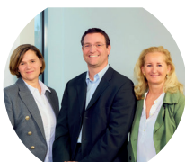
Sales Team DERTOUR Austria

Unter dem Label „ Top Choice “ vereint die DERTOUR Group ihre besten Hotelmarken der DERTOUR Hotels & Resorts sowie der DRS Hotel Holding und ausgewählte, exklusive Partnerhäuser weltweit. Top Choice erleichtert und belohnt Ihre Beratung: Ab der ersten Buchung eines TOP CHOICE Hotels sichern Sie sich attraktive Zusatzserträge. Nähere Informationen erhalten Sie bei Ihrem DERTOUR Austria Vertriebsteam oder auf ComeCloser.