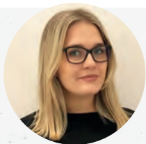
Nejra Kevelj Seereisen Center

Telefon 01/713 22 70 www.seereisen-center.at office@seereisen-center.at www.oceaniacruises.com